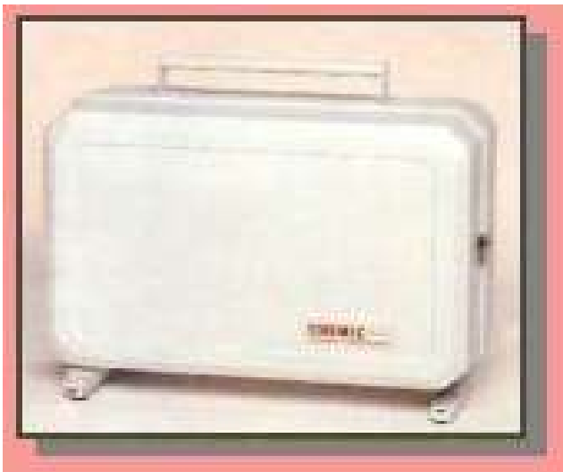
Proiettore chiuso - Closed projector - Projecteur fermé